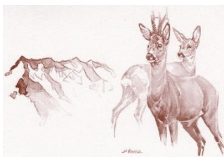
Jägersektion Falknis BKPJV

Samstag, 02. Mai 2020 08.00 - 12.00 Uhr 13.00 - 16.00 Uhr